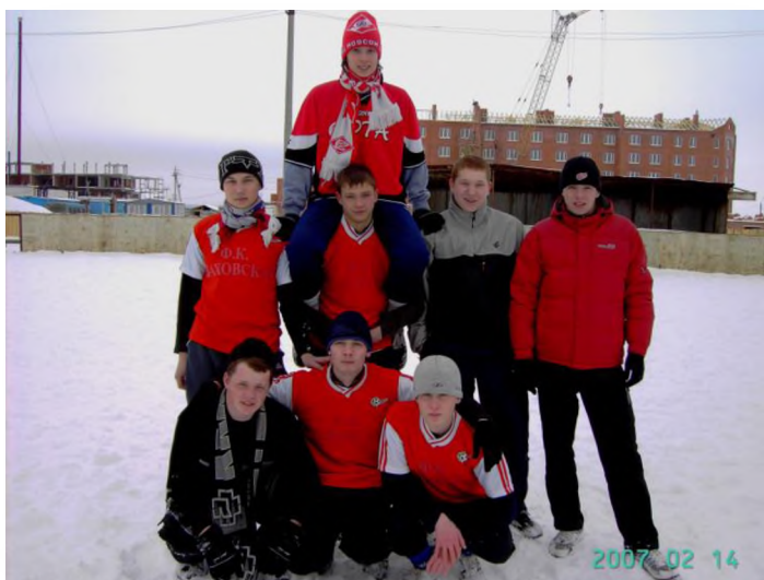
Победа досталась команде группы ПБ-31