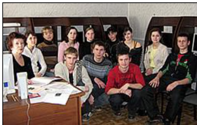
На фото: члены Научного общества студентов

На конференциях всем студентам, выступавшим со своими творческими работами, были вручены билеты членов Научного общества студентов Волоколамского техникума экономики и права.