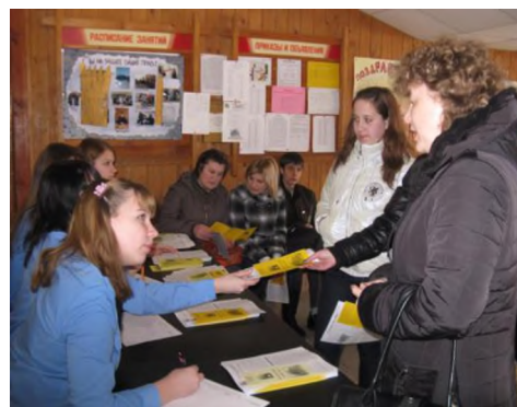
Второй раз День открытых дверей состоится 16 мая в 11 час.

коламского района, о чем свидетельствовали прибывшие школьники.