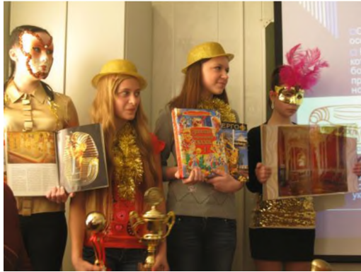
Участники проекта – гр. ПВД-12

В период с 30 ноября по 7 декабря в нашем колледже проходила Неделя студенческой науки для 1 курсов. Были проведены «Веселые старты», олимпиада по информатике и литературе, конкурс «Увлекательный английский», интеллектуальные игры, студенческие чтения по истории, посвященные 400-летию освобождения Москвы от поляков, и самое зрелищное мероприятие - защита творческих исследовательских проектов «Выборы в стране Металлов». Неделя науки была очень насыщенной и интересной.