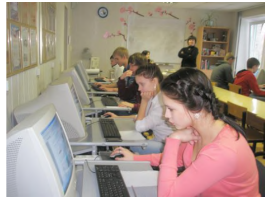
Участники олимпиады по информатике