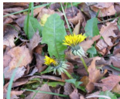
«30 октября: последний привет лета»